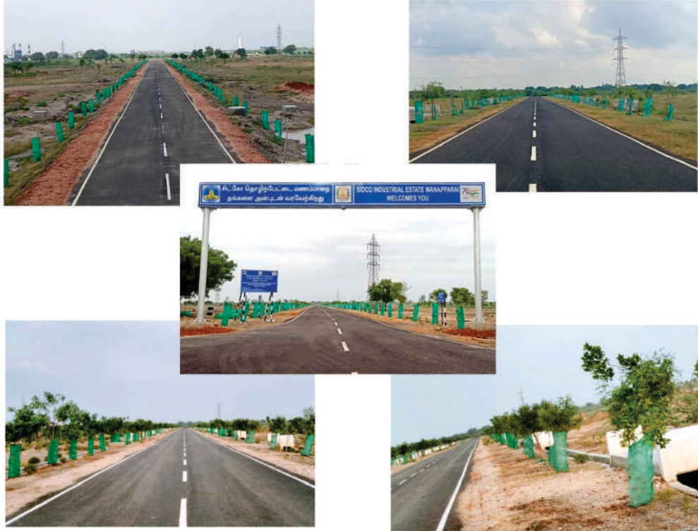
திருச்சி மாவட்டம் மணப்பாறையில் புதிய தொழிற்பேட்டை